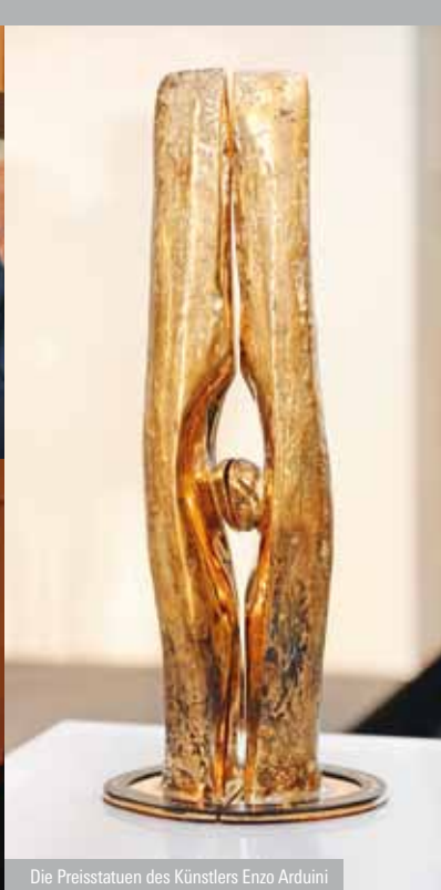
Die Preisstatuen des Künstlers Enzo Arduini