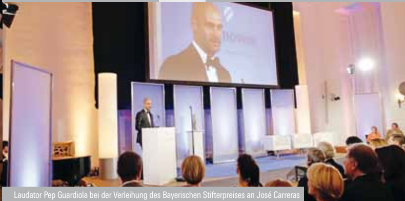
Laudator Pep Guardiola bei der Verleihung des Bayerischen Stifterpreises an José Carreras