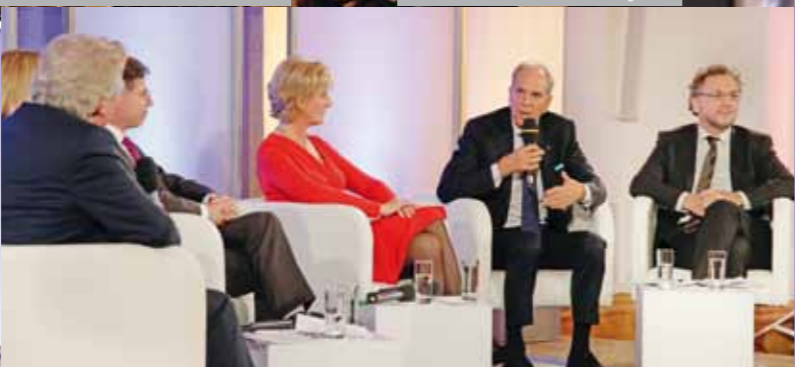
Podiumsdiskussion anlässlich des 25. Jahrestages der UN-Kinderrechtskonvention