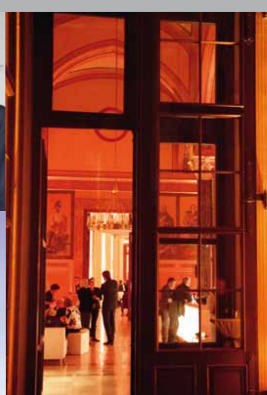
Angeregte Gespräche im Lesesaal des Bayerischen Landtags